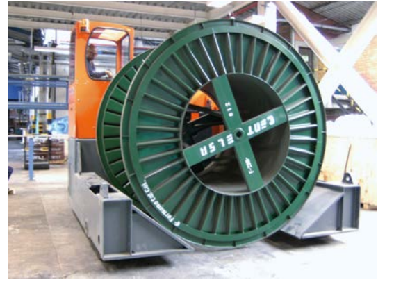
Kolombiya da bir müşteri de KT 200 görev başında

5,0 m çapa ve 3,5 m genişliğe kadar, her türlü boru veya kablo makaraları taşıyabilirsiniz.