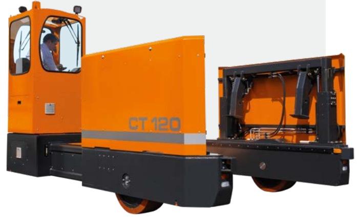
Döner kollar ile yük alma