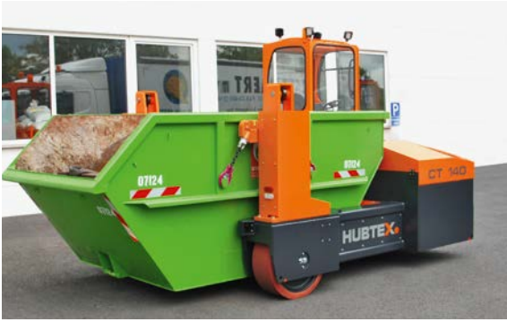
Kaldırma tertibatı ile alınan çok amaçlı tekneye sahip HUBTEX tekne taşıyıcı