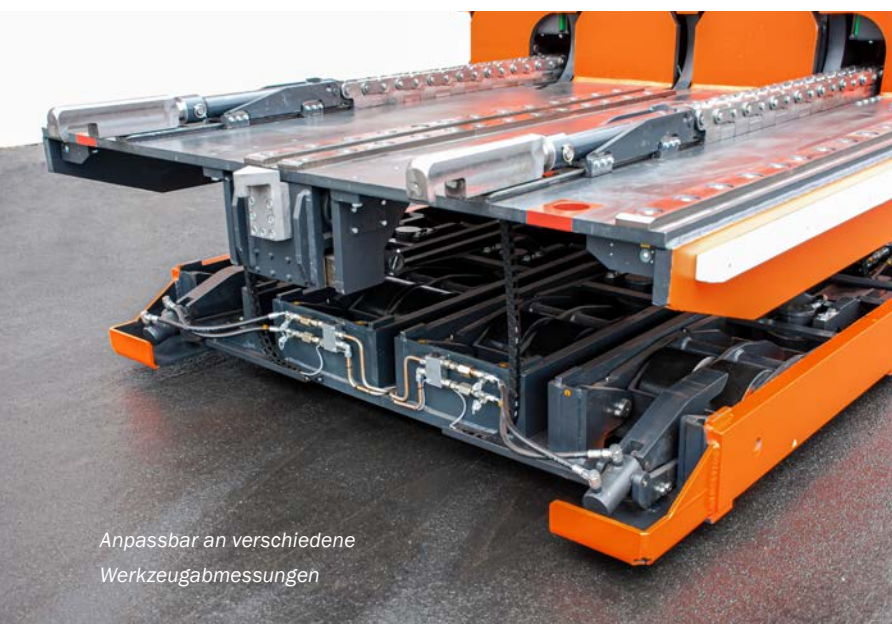
Anpassbar an verschiedene Werkzeugabmessungen