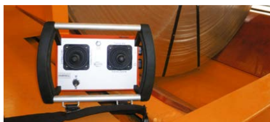
Wahlweise Kabel- oder Funkfernsteuerung