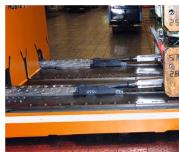
Extrem niedrige Tischhöhen