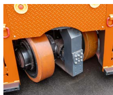
Die Fahrzeuge verfügen über einen großen Lenkwinkel