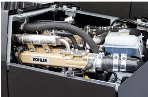
Motor turbo silencioso

Gracias a la combinación de un control inteligente del motor, bombas y ventilador, este vehículo ha podido equiparse por vez