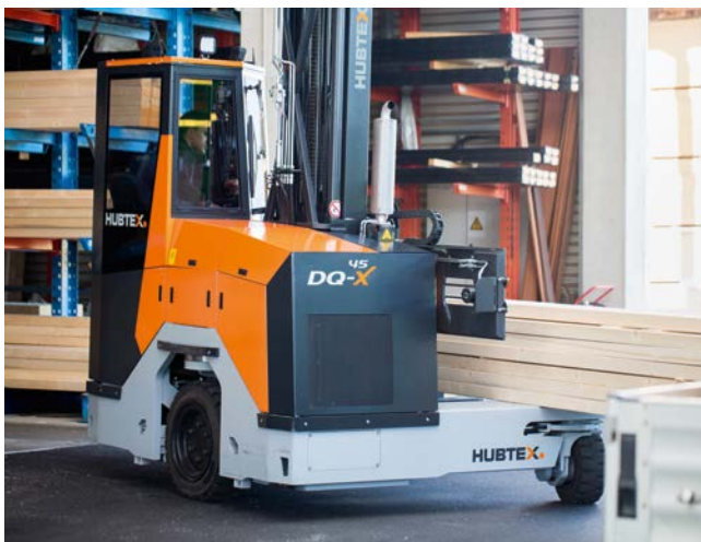
El freno de mano se activa automáticamente durante el cambio de la dirección de marcha.